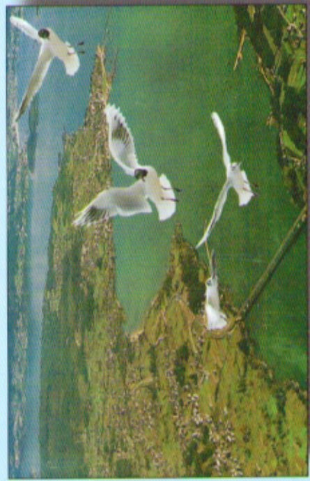
Foto: Avila, Pizarro, Mera, 13, 14, 15, 16, 17, 18, 19, 20, 21, 22, 23, 24, 25, 26, 27, 28, 29, 30, 31, 32, 33, 34, 35, 36, 37, 38, 39, 40, 41, 42, 43, 44, 45, 46, 47, 48, 49, 50, 51, 52, 53, 54, 55, 56, 57, 58, 59, 60, 61, 62, 63, 64, 65, 66, 67, 68, 69, 70, 71, 72, 73, 74, 75, 76, 77, 78, 79, 80, 81, 82, 83, 84, 85, 86, 87, 88, 89, 90, 91, 92, 93, 94, 95, 96, 97, 98, 99, 100